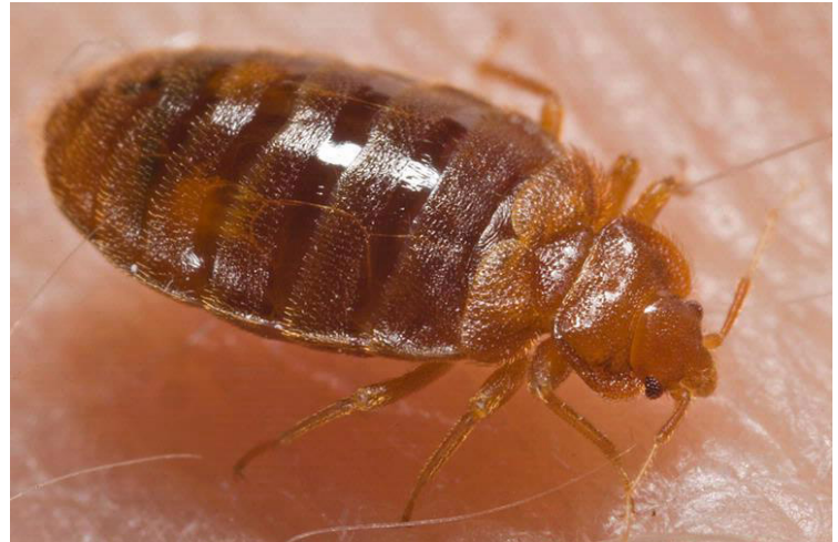
Les punaises de lit adultes peuvent vivre un an sans aucune nourriture!!!

« Les punaises de lit sont bien adaptées pour cohabiter avec les humains. À l'instar d'autres parasites accomplis, elles préfèrent une grande proximité avec le prochain repas. La punaise de lit étant un insecte nocturne, ceci l'amène à se loger là où les gens dorment ou se reposent. Des enquêtes récentes d'appartements infestés ont démontré que, par exemple, plus de 90% des insectes ont été retrouvés dans des lits, des divans et des fauteuils inclinables » (« Bat tling Bed Bugs in Apartments » PCT (Pest Control Technology) August 2006).